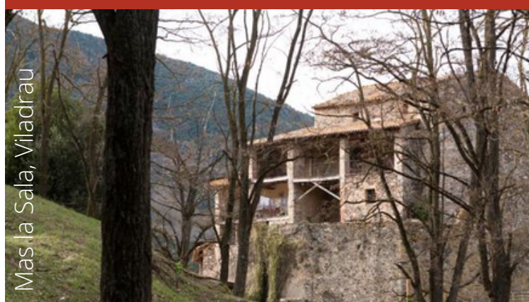
Mas la Sala, Viladrau

Organitza: Aprèn, Serveis Ambientals Punt de trobada: Aparcament de la residència de la Font dels Enamorats (Aiguafreda) Horari: De 10.00h a 13.00h Reserves: apren@apren.cat - T 938 429 361