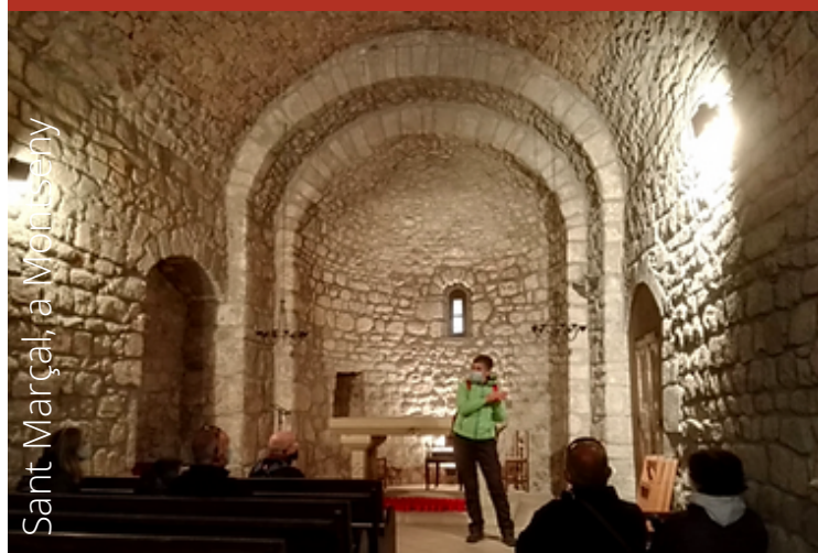
Sant Marçal, a Montseny

Organitza: Ademc Itineraris Montseny Punt de trobada: Aparcament Coll de Sant Marçal Horari: De 10.00h a 13.00h Reserves: info@ademc-montseny.cat -T. 938 482 008 / 661 959 737